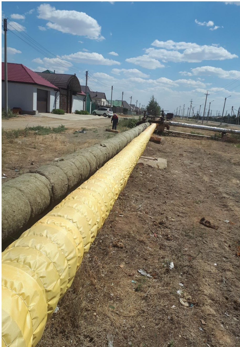
7. Капитальный ремонт теплосети подводящая от выхода из канала до ул. Маргулана— закончен (июль)