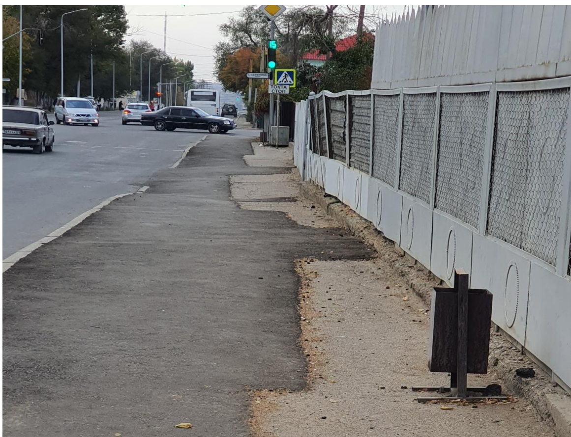
6. Капитальный ремонт - Поливочного водопровода по ул. Абая от ул.Смайлова до ул.Байконурова