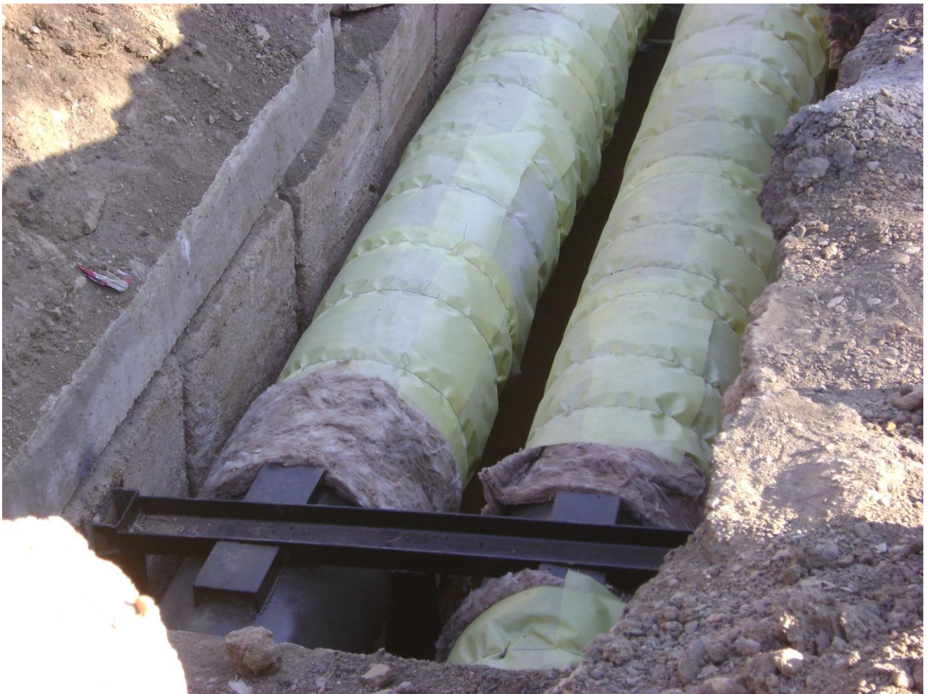
3. Капитальный ремонт тепломагистральной №9: прямой и обратный трубопровод ул. Байконурова от ул. Салыкбаева до Аманжолова