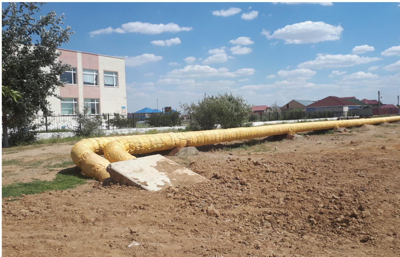
7. Капитальный ремонт теплосети подводящая от выхода из канала до ул. Маргулана– закончен (июль)