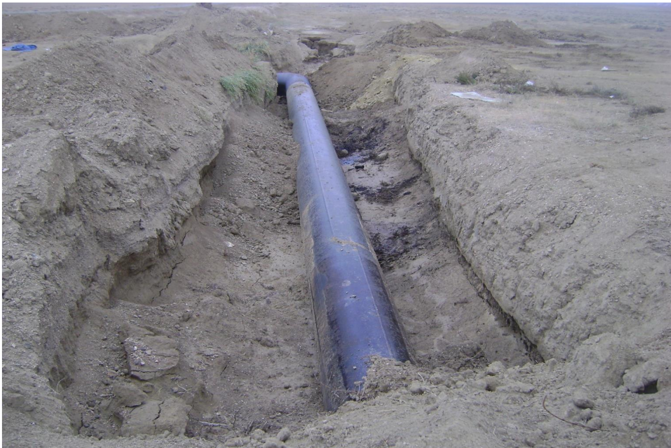
5. Замена аварийных участков Уйтас-Айдосского водовода