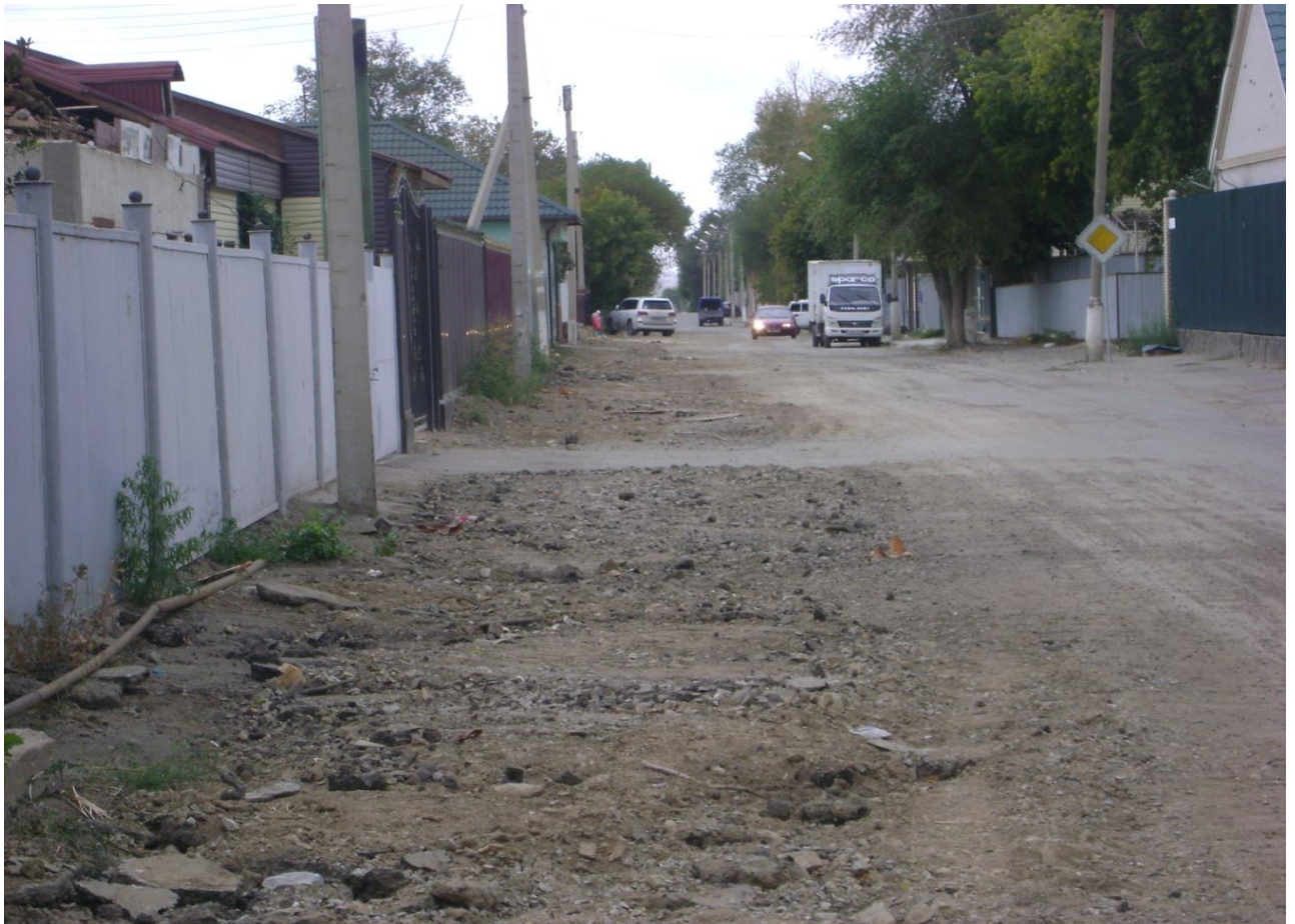
4. Капитальный ремонт теплосети по ул. Асылбекова, ул. Аубакирова