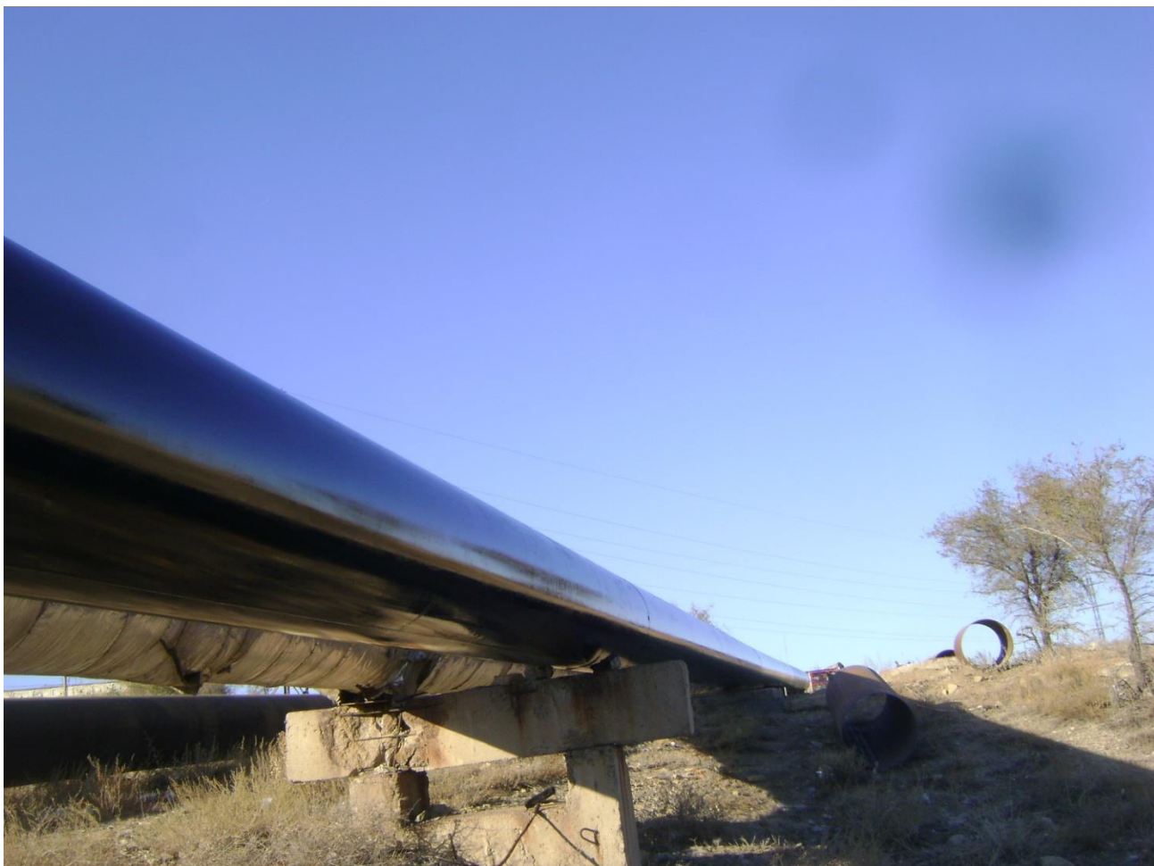
1. Капитальный ремонт тепломагистрали №11: прямой и обратный трубопровод от ТК-7 до платины н/станции БКГС